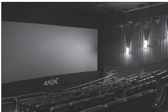
Átlagos és mégis más

Naponta általában két filmet vetítenek, azokat viszonylag sok időpontban. Választásom a G.I. Joe: Megtorlás című