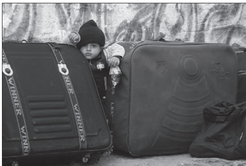
Ha nincs mit (t)enni, elmegyünk.

de szemléltethetik a kelet-közép-európai régióban zajló folyamatokat. Az országunkhoz hasonló lakosságú, de gazdasági-