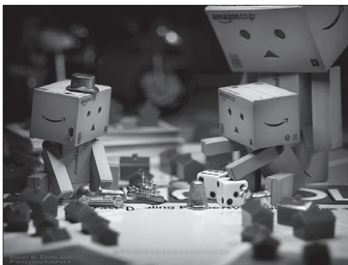
Aból tudunk építkezni, amink van

A gazdálkodási folyamat átlátásához az egyik legfontosabb tény, amivel tisztában kell lenni, hogy a gazdálkodás gazdasági években történik, ami a naptári évvel megegyező. Ez az oktatási intézmények számára nem épp a legoptimálisabb, hiszen mi az éveket gyakorlatilag szeptember-július viszonyában számítjuk, nem január-december időtartamban. Ez