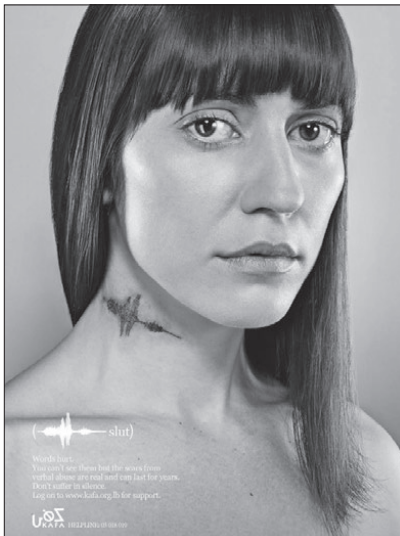
A nőkkel szembeni erőszak ellen

A társadalmi célú reklámot nem lehet ingyen reklámként felhasználni a piacon, még akkor sem, ha a konkurens „összetartanak”. A gazdasági érdek tehát nem, a félelemkeltés azon-