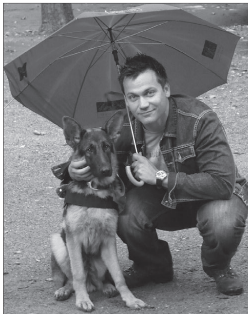
A sztárok is kiállnak a nemes célokért

san sikerült, hiszen az alapítványt fel is jelentették a hirdetés brutalitása miatt, de a vizsgálódások után a Magyar Reklámszövetség úgy döntött, etikailag nem kifogásolható a jelenet.