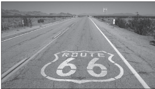
Vajon hová vezet az út?

Generációkon átívelő, de folytonosan megújuló mítoszának felállításához John Steinbeck 1939-ben papírra vetett, Érik a gyümölcs című regénye kellett, melynek központi témája a közösségi erőfeszítés magasztalása és szembeállítása az egyéni nyereségvágygal; ezzel a New Deal szellemiségét idézte meg építésének időszakában. A háború után, a gazdasági prosperitás időszakában a „családi vakáció” klasszikus terévé vált, ezzel párhuzamosan pedig számos, az út mentén található